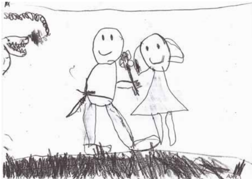
Tecknat av förskolebarn på Lidingö

Ett intressant ytterligare resultat var att pedagogerna såg en positiv