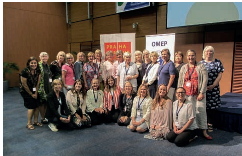
Den svenska gruppen vid världskonferensen i Prag 2018.

Medlemmar i OMEP representerar och driver frågor om barnets bästa i vitt skilda sammanhang, ett arbete som bidragit till statliga och kommunala utredningar och utveck-