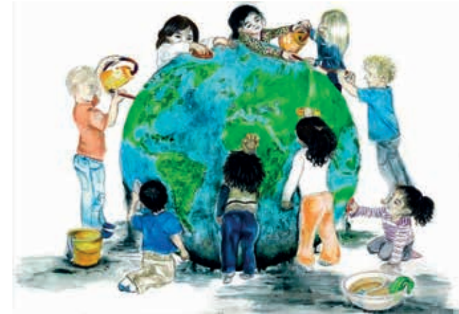
Logotype till världskongressen i Göteborg 2010.