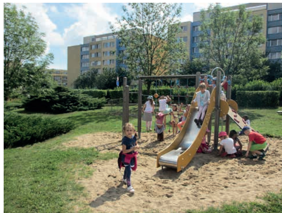
Lek på förskolegård i Prag.

En förändrad barnsyn, ett lyssnande förhållningssätt eller en förändrad organisation bidrar till ökad medvetenhet och möjligheter för barnen att påverka sin vardag nu och i framtiden. |