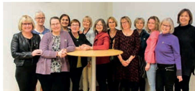
Svenska OMEP:s styrelse 2018.

Svenska OMEP vill dessutom arbeta för att stärka det nordiska samarbetet med utgångspunkt i de