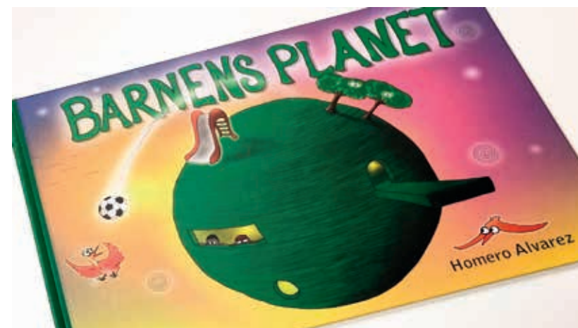
Barnens planet – barnbok gjord i projektet.

I oktober 2018 lanseras Barnens planet för resten av Sverige. |