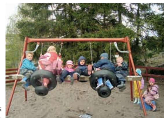
Bild från OMEP:s projekt Barns delaktighet i det fysiska rummet .