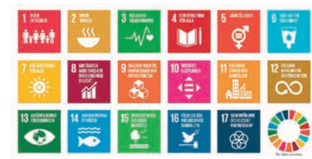
FN:s globala mål.