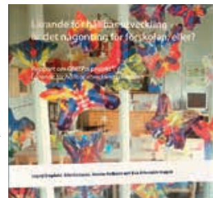
Hållbar utveckling – är det något för förskolan?

(8) OMEP organiserar sedan 2010 en årlig internationell utmärkelse för projekt för hållbarhet. |